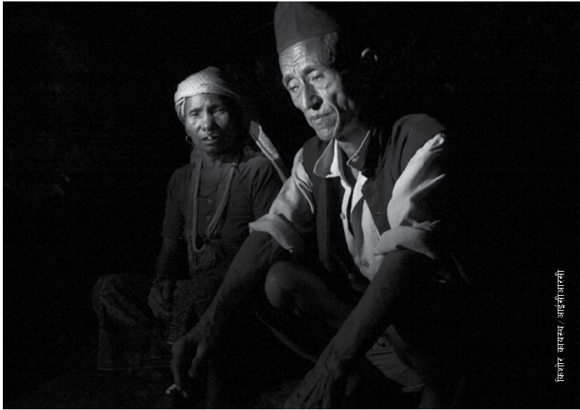
किशोर कायस्थ / आइसीआरकी