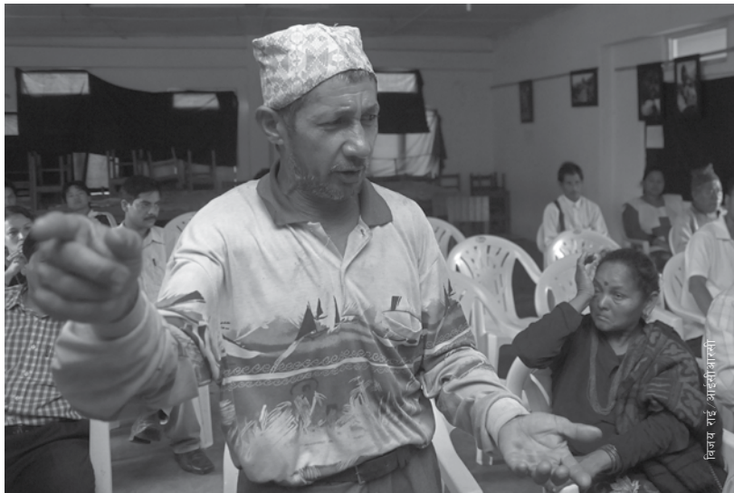
विजय राई / आइसीआरकी

मानव जातिले युद्ध लड्दै आएदेखि नै मानिसहरू बेपत्ता हुँदै आएका छन् । बेपत्ता हुने परिस्थिति फरक-फरक हुन्छन्: मानिसहरू मारिन्छन् र उनीहरूलाई कुनै किसिमको चिन्ह अङ्कित नभएको चिहानमा गाडिएको पनि हुन सक्छ; मानिसहरू सडकबाट वा घरबाट समाती लगेर थुनेको र थुनामै मृत्यु भएपछि आफन्तलाई जानकारी नदिएको पनि हुन सक्छ । बेपत्ता भएका अन्य व्यक्तिहरूमा युद्धको क्रममा मरेका/मारिएका सर्वसाधारण नागरिक वा योद्धा हुन सक्छन् र उनीहरूको लासको सनाखत नगरिएको र प्राप्त नभएको पनि हुन सक्छ । यस्तो घटना बेपत्ता भएका व्यक्तिहरूको निम्ति आफैमा एउटा दुःखान्त घटना हो तर उनीहरूका परिवारका सदस्यहरू पनि पीडित भएका हुन्छन् । बेपत्ता भएको व्यक्ति जिउँदै छ या मरिसक्यो भन्ने कुरा निश्चित नभएको स्थितिले तिनका परिवार यस द्विविधाको अन्त्य गर्न नसकी आफ्नो जीवनलाई यथावत रूपमा अगाडि बढाउन सक्दैनन् ।