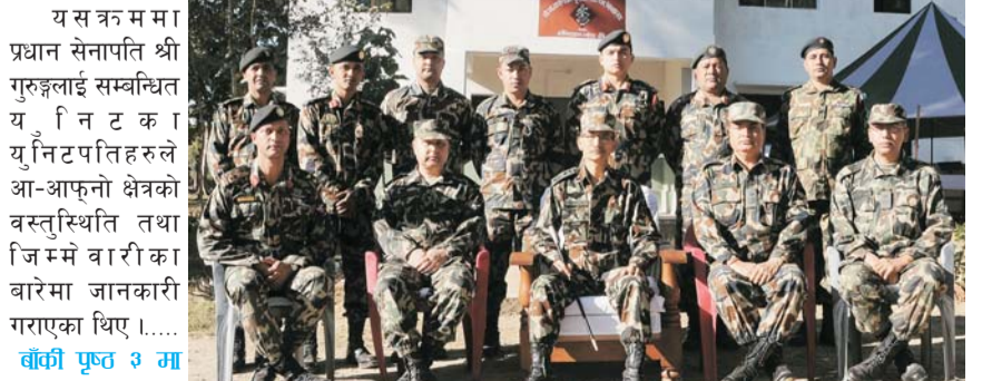
मध्यपश्चिम पूतना तालिम शिक्षालय निरीक्षणपछि प्रधान सेनापतिसहित रथीवृन्दहरू ।