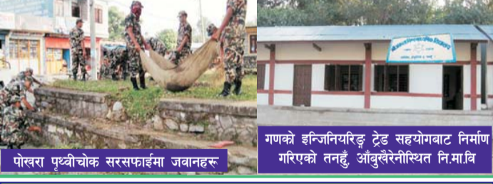
पोखरा पृथ्वीचोक सरसफाईमा जवानहरु गणको ईन्जिनियरिङ्ग ट्रेड सहयोगवाट निर्माण गरिएको तनहुँ, आँबुखैरेनीस्थित नि.मा.वि