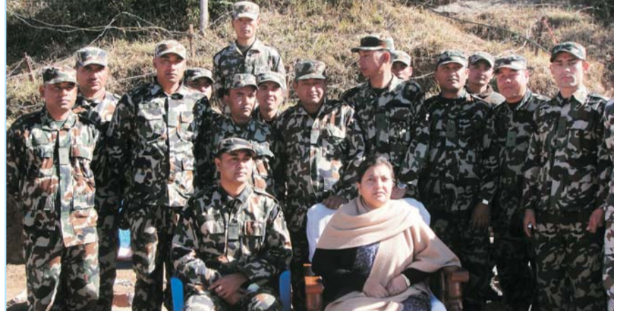
गुल्म निरीक्षणका क्रममा अधिकृत तथा पदिकवर्गसंग रक्षामन्त्री श्रीमती विद्यादेवी भण्डारी।

माननीय रक्षामन्त्री श्रीमती विद्यादेवी भण्डारीले गत मङ्सिर १८ गते कालीकोटस्थित श्री रणदल गुल्मको निरीक्षण भ्रमण गर्नुभई गुल्मका सकलदर्जालाई सम्बोधन गर्नुभयो ।