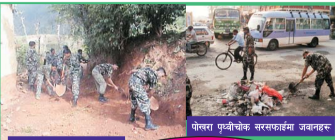
बेल्टारी, स्याङ्जा सडक मर्मत पोखरा पृथ्वीचोक सरसफाईमा जवानहरु