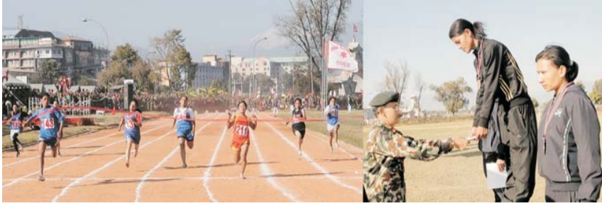
गत मङ्सिर १९ गते भएको महिला सैनिकहरूको १०० मीटर दौडमा मध्यपूतनाकी सिपाही