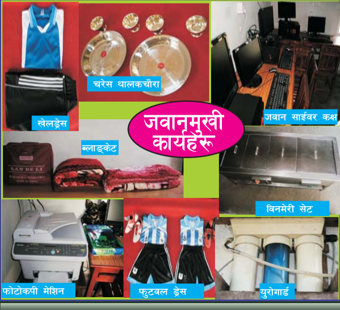
चरेस थालकचोरा खेलड्रेस ब्लाङ्केट विनमेरी सेट फोटोकपी मेसिन फुटबल ड्रेस युरोगार्ड जवान साईबर कक्ष