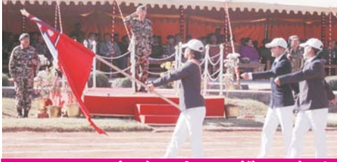
उद्घाटनका क्रममा मार्चपासको सलामी ग्रहण गर्नुहुँदै प्रधान सेनापति।

प्रधान सेनापति ट्रिफ खेलकुद प्रतियोगिता २०६७ को गत मङ्सिर १९ गते जङ्गी अड्डा अगाडिको विजयी हुन्छु भन्ने आँटले खेल प्रदर्शन गर्न आग्रह गर्नुभयो । साथै उहाँले खेलाडीहरूको लगन, परिश्रम