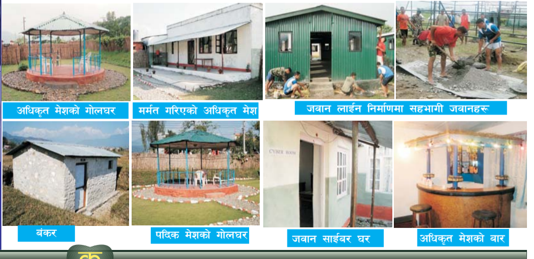
अधिकृत मेशको गोलघर मर्मत गरिएको अधिकृत मेश जवान लाईन निर्माणमा सहभागी जवानहरु वंकर पदिक मेशको गोलघर जवान साईबर घर अधिकृत मेशको बार