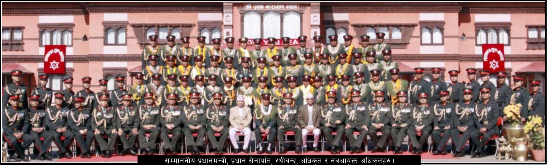
सम्माननीय प्रधानमन्त्री, प्रधान सेनापति, रथीवन्द, अधिकृत र नवआयुक्त अधिकृतहरु ।