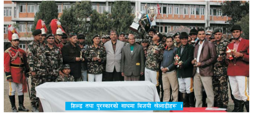
शिल्ड तथा पुरस्कारको साथमा विजयी खेलाडीहरु