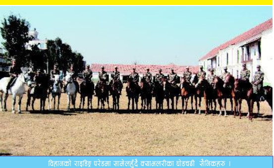
विहानको राइडिङ परेडमा सातेलहुँदै क्याभलरीका घोडाचढी सैनिकहरू ।

यस क्याभलरीको निशान बडा दशैको नवमीको दिन र चैते दशैको अष्टमीको दिन बग्गीमा विराजमान गरिदै न्याउली बाजा, ढोल, तमोर, खुकुरी गाउँ ४ जना, हतियार गाउँ २ जना तथा भएसम्म अनि र पनि लाई पदिक कमाण्डमा ल्याउने गरिएको छ । पूजा समाप्त भएपश्चात् पुनः सोही बग्गीजिम पुर्‍याउने गरिदै आएको छ ।