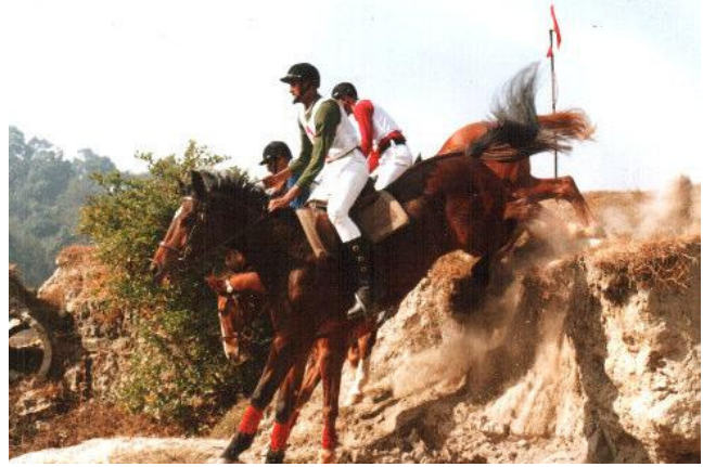
क्रस कन्ट्रि अभ्यास गर्दै क्याभलरीका घोडचढी सैनिकहरु ।

भाग्यशाली चिह्नमा: जम. जगदिश घिसिङ्ग प्रथम