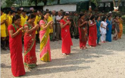
बार्षिकोत्सवको अवसरमा आयोजित पाहुना खेल अन्तर्गत सियोधागो खेलमा सहभागी हुँदै सकलदर्जाका परिवारहरु ।