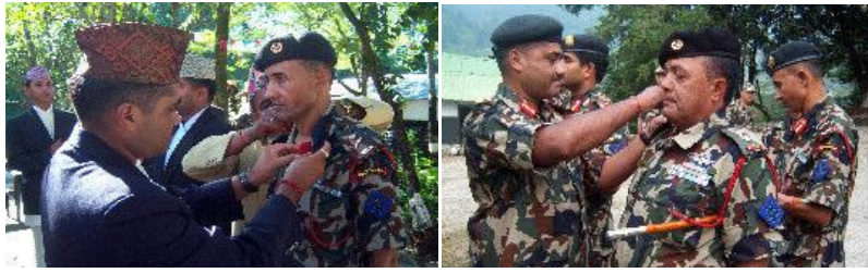
हालै मानार्थ उप सेनानी दर्जा र प्रमुख सुवेदार दर्जामा पदोन्नति हुनुभएका गणका पदिकहरूलाई दर्जानी चिन्ह प्रदान गर्नुहुँदै गणपति ।