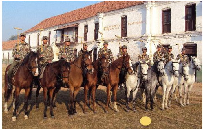
अश्वकला अन्तर्गतको हर्ष पोलोको एक दृश्य ।