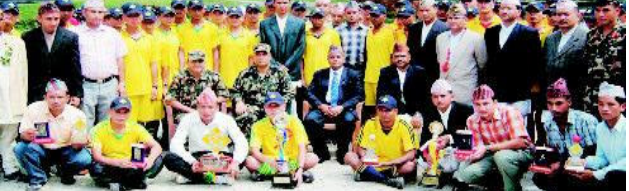
आमन्त्रित अतिथिहरूसँग वार्षिकोत्सवको अवसरमा आयोजित विभिन्न खेलकूद प्रतियोगिताका विजयी खेलाडीहरू।

अनाथ बाल बालिकाहरूलाई भोजन गराउने कार्यक्रम गरियो। २०६६ साल असोज ४ गते विभिन्न सांस्कृतिक कार्यक्रमको आयोजना गरी सकल दर्जा परिवारजन आमन्त्रित गरी विभिन्न पाहुना खेलहरूको आयोजना गरियो।