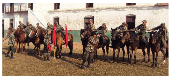
वार्षिकोत्सवको अवसरमा आयोजित अन्तर टुप्स हर्ष तानडोरी प्रतियोगिता ।