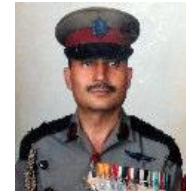
प्र.से. श्री हिक्मत बहादुर चन्द्र वि.सं. २०५५।१।२८ गतेदेखि वि.सं. २०५८।३।१३ गतेसम्म