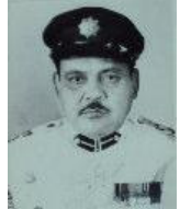
प्र.से. श्री लालित्य शम्भेर ज.ब.र. वि.सं. २०३६।१।४ गतेदेखि वि.सं. २०४२।१।९ गतेसम्म