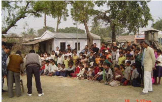
इलाका प्रहरी कार्यालय हनुमान नगर सप्तरीका प्रहरी तथा स्थानीय जनताहरूलाई विगत द्वन्द्वको समयमा लगाइएको विष्फोटक पदार्थबाट हुन सक्ने खतराबाट बच्ने उपाय बारे चेतनामूलक कार्यक्रम सञ्चालन गर्दै कालीबक्स गणबाट खटिएको टोली ।