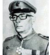
प्र.से. श्री पुर्न विक्रम राणा वि.सं. २०२८।१।२१ गतेदेखि वि.सं. २०३६।१।४ गतेसम्म