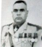
प्र.से. श्री लाल बहादुर खड्का वि.सं. २०२०।१।६ गतेदेखि वि.सं. २०२४।१।९ गतेसम्म