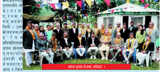
मध्य पृतना हे.क्वा. परिवार ।

यसैगरी वार्षिकोत्सवकै अवसरमा आयोजित टेनिस, ब्याटमिण्टन तथा फुटबल खेलहरूका विजयी