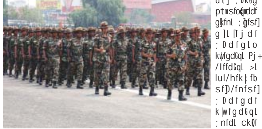
nf]stG lbj ; sf]pknloaf d'f'f; k]t't ubx]gkfnl ; d'f.

lyP . ; f]cj ; /df gkfnl ; d'fsf]@ j 6f x]hsk6/af/f nf]stG n]lvPsf]Aofg/ k]b'z@ tyf k]k]l6 ; d]: ul/Psf]lyof]. ; f]cj ; /df gkfnl ; d'fsf] Ps 6fh]n] ah]g p8f0{ sfoqndnf0{cem/d'f0f]agfPsf]lyof]. ; lgs d-r 6l8vhd f oxl aZfv !!