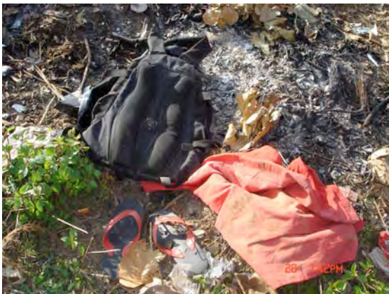
माओवादीको कपडा जलाइएको स्थान