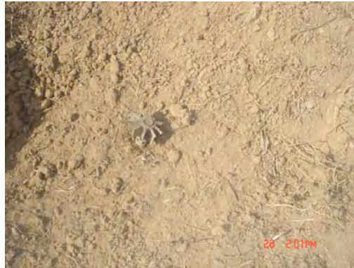
बस्ती नजिक हेलिकोप्टरबाट बम फाल्दा भएको खाल्डो