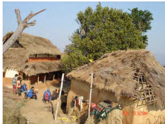
हेलिकोप्टरले उडाएको सर्वसाधारणको घरको छानो