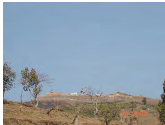
चित्रभञ्ज्याङको सैनिक बेस क्याम्प