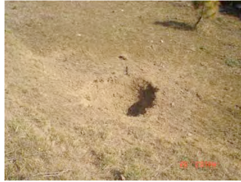
बस्ती नजिक हेलिकोप्टरबाट बम फाल्दा भएको खाल्डो