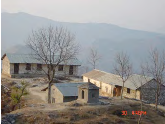
आक्रमण गरिएको थानापति प्रावि

किचनास गाविस-६ खैरीकोटमा रहेको थानापति प्राथमिक विद्यालयमा सेनाले हवाई आक्रमण गरी गम्भीर क्षति पुऱ्याएको छ । सेनाले २०६२ पुस २८ गते दिउँसो १२ बजेदेखि २ बजेसम्म विद्यालयमा आक्रमण गरेको थियो । विद्यालयमा पढाई चालु रहेको अवस्थामा विद्यालय हाताभित्र करिब २० जना माओवादी प्रवेश गरेपछि विद्यालयलाई निसाना बनाएर दुई वटा सैनिक हेलिकप्टरबाट आक्रमण गरिएको थियो । आक्रमणबाट विद्यालयको भित्ता र छानामा जताततै प्वाल परेको छ ।