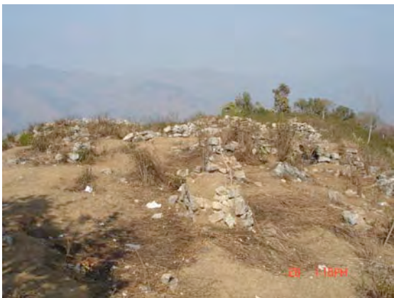
चिहानडाँडास्थित सर्वसाधारण राखिएको बंकर