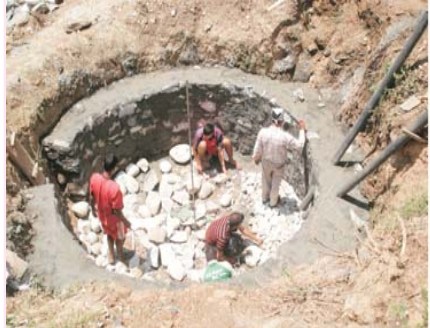
भीमदल गणमा बायो ग्याँस प्लान्ट निर्माण गरिँदै ।

विगतमा पनि सो गणले गण हे.क्वा सिलगढीमा बायो ग्याँस निर्माण गरी त्यस स्थानमा हुने