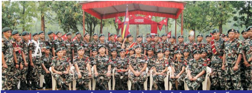
सैन्य आधार तालिम समापनपश्चात् सामूहिक तस्वीरमा तालिम केन्द्रका केन्द्रपति, शिक्षकवर्ग तथा शिक्षार्थीहरू ।