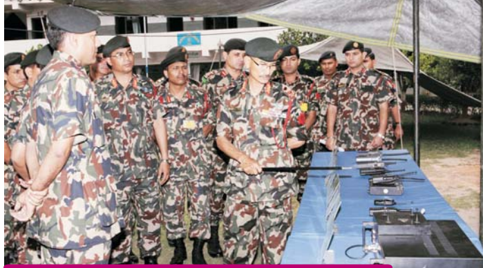
प्रधान सेनापति श्री छत्र मान सिंह गुरुङ सिग्नल उपकरणहरूको निरीक्षण गर्नुहुँदै ।

उक्त अवसरमा प्रधान सेनापति श्री गुरुङले सो शिक्षालयमा सञ्चालन हुने तालिमहरूलाई दृष्टिगत गरी निर्माण गरिएको डिजीटल ल्याब, ईलेक्ट्रोनिक ल्याब, प्रोग्रामिङ ल्याब, कम्प्युटर ल्याब तथा