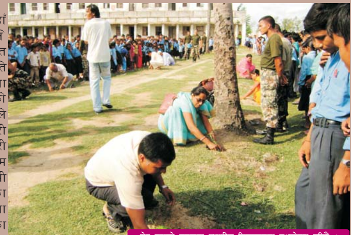
शेर गणको पहलमा स्थानीय विद्यालयमा बृक्षरोपण गरिँदै ।

“जहाँ शेर त्यहाँ जंगल” भन्ने वाक्यांशलाई प्रमाणित गर्न गत असार १३ गते वन महोत्सव तथा बृक्षरोपण दिवसको उपलक्ष्यमा शेर गणले आफ्नो जिम्मेवारी क्षेत्रभित्र पर्ने महोत्तरी जिल्लाको सदरमूकाम जलेश्वरस्थित लक्ष्मी चण्डिका मरारका मा.वि.को परिसरमा विभिन्न प्रजातिका विरुवाहरू रोपेको छ ।