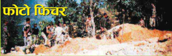
दोरगवाग विद्यालय गवन विभागाध्यक्ष अमदाम नदी नारायण दल गणका सकल दर्जाहरू (२०६४) ।