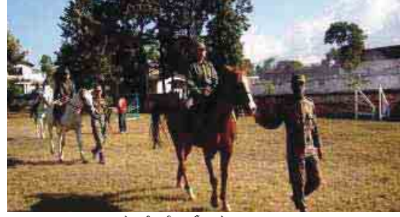
घोडचढी तालिम गर्दै क्याडेट छात्रछात्राहरू।

संस्थागत तालिम अन्तर्गत छात्र/छात्राहरूलाई सैनिक जीवनका आधारभूत तालिमहरू दिइन्छ। यस तालिमको उद्देश्य छात्र/छात्राहरूलाई सैनिक जन-जीवनको साथै उनीहरूलाई शारीरिक तथा मानसिकरूपमा चुस्त, फूर्तिलो, कर्तव्य बोध गर्न सक्ने असल व्यक्तित्व भएको एक अनुशासित नागरिक बनाउनु हो। यस अन्तर्गत शारीरिक व्यायाम, ड्रिल, तेक्वाण्डो, खुकुरी ड्रिल, नक्शा अध्ययन, प्राथमिक उपचार र अन्त्यमा वार्षिक सामाजिक तथा सैनिक क्याम्प सञ्चालन गरिन्छ। क्याम्प ट्रेनिङ्ग राष्ट्रिय सेवा दल तालिमको ज्यादै महत्वपूर्ण भाग हो, जहाँ अधिराज्यभरका छात्र/छात्राहरूले हर्ष एवम् उल्लासपूर्ण वातावरणमा तालिम सम्पन्न गर्दछन्। यस क्याम्पमा नेपाल