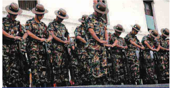
वीरगति प्राप्त सैनिकहरूलाई पशुपति आर्यघाटमा अन्तिम सम्मान अर्पण गरिदै ।

यही वैशाख १० गते रामेछाप जिल्लाको श्रीखान डाँडाको आगलागीमा परी वीरगति प्राप्त वीर सैनिकहरूको मध्य ८ जनाको यही वैशाख ११ गते प्रधान सेनापति महारथी श्री रुकमाङ्गद कटवाल लगायत रथीवन्दहरूको उपस्थितिमा पशुपति आर्यघाटमा अन्तिम दाहसंस्कार सम्पन्न भएको छ । बाँकी ५ जना वीर सैनिकहरूको शव भने आफन्तहरूले बुकि उहाँहरूलाई दाहसंस्कार गरिएको छ ।