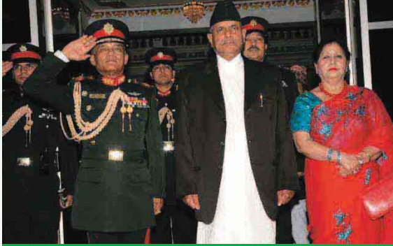
सन्माननीय राष्ट्रपति डा. श्री रामवरण यादव र वरिष्ठ अधिकारी उपलक्ष्यमा जङ्गी अड्डाद्वारा आयोजित शुभकामना आदानप्रदान तथा रात्रीभोजमा अवसरमा डिप्टी कमन्डिन्ट जनरल नेपाली सेनाद्वारा अतिथि सलामी ग्रहण गर्नु हुँदै ।

राष्ट्रपति एवं नेपाली सेनाका परमाधिपति डा श्री रामवरण यादव नेपाली सेनाद्वारा नववर्ष २०६६ को उपलक्ष्यमा यही वैशाख १ गते सांस्कृतिक जङ्गी अड्डामा आयोजित रात्री भोजमा सरिक हुनु भयो ।