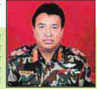
महारेवाजी आनन्द बरशिद राणा नित्त प्रमुख सल्लाहकार

वि.सं. २०२४ सालमा भण्डा प्राप्त गरेपछि उक्त भण्डामा अङ्कित सरस्वतीको षष्टकोण भित्र दुई खुकुरी र वीचमा कलम रहेको चिन्हलाई नै राष्ट्रिय सेवा दलको प्रतिक चिन्हको रूपमा मानि वि.सं. २०३९ सालबाट राष्ट्रिय सेवा दलको आदर्श