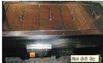
बिन मेरी सेट

जवान वर्ष २०६५ को उपलक्ष्यमा राष्ट्रिय सेवा दलले खाना तातो राख्न जवानहरूको लागि १ सेट बिनमेरी सेट खरिद गरी जवान भान्सामा प्रयोग गर्दै आइरहेको छ । जवान वर्षको उपलक्ष्यमा जवानहरूको स्वास्थ्यलाई मध्यनजर राखी स्वच्छ पानी पिउनको लागि युरो गाई खरिद गरी भान्सामा प्रयोग गरिएको छ । त्यसैगरी जवानहरूको लागि जवान भान्सामा खाना खानको लागि मार्बलको डार्डिन ट्रेबल र वेन्च प्रयोगमा ल्याइएको छ ।