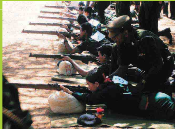
YEP अन्तर्गत श्रीलंका भ्रमणको सिलसिलामा फायरिङ्ग अभ्यास गर्दै नेपाली छात्रछात्राहरू ।