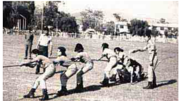
जुनियर डिभिजनका छात्रहरु तानडोरी प्रतिस्पर्धा गर्दै (वि.सं. २०३४)।