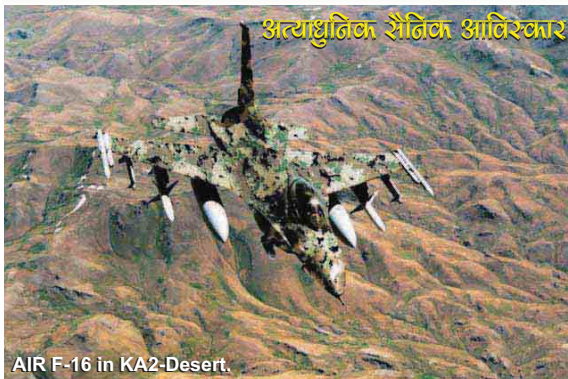
AIR F-16 in KA2-Desert.