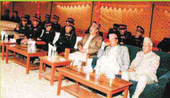
अन्तिम दिक्षान्त कवाज अवलोकन गर्नुहुँदै रथीबन्ध तथा सेवादलका पूर्व प्रमुख सल्लाहकारहरू ।