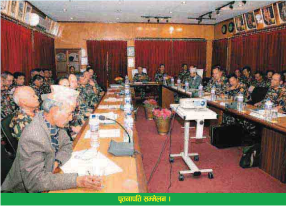
पूतनापति सम्मेलन ।

विगतमा भई यसपल्ट पनि नियमितरूपमा सम्पन्न भएको उक्त सम्मेलनमा पूतनापतिहरूले आ-आफ्नो पूतनाका जिम्मेवारी क्षेत्रका पेशागत तथा व्यवहारिक समस्याहरूका बारेमा छलफल गर्नुभएको थियो ।