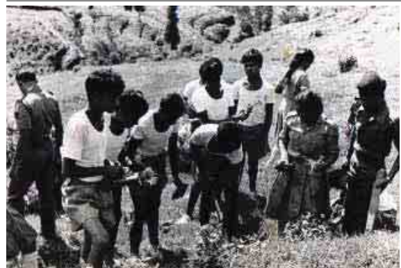
जुनियर डिभिजनका छात्रछात्राहरु वृक्षारोपण गर्दै (वि.सं. २०४१)।