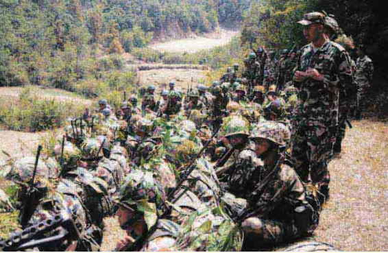
तालिमको एक दृश्य ।

यसका अतिरिक्त गणको आन्तरिक श्रोत, साधानबाट पनि विभिन्न तालिमहरू सञ्चालन भएका छन् । जसमा युनिट आधार, ड्रिल (सम्मान गारत, ब्या.गाई, मरुवा गाई आदि), आर.पी. तालिम, बेटार तालिमहरूका छन् । यसैगरि समसामयिक वैतरी शिक्षा तालिमसमेत गराइएको छ ।