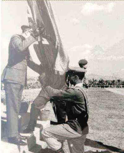
वि.सं. २०२४ साल फाल्गुन ७ गतेका दिन तत्कालीन श्री ५ महाराजाधिराज महेन्द्र वीर विक्रम शाहबाट निशान भण्डा ग्रहण गर्ने क्रममा श्री राष्ट्रिय सेवा दल

छात्र/छात्राहरूलाई साधारण सैनिक तालिम दिई उनीहरूमा देशप्रीति वफादारीको भावना अरु बढी जागृत गराउन र आत्मविश्वास तथा नेतृत्वको क्षमता बढाउने उद्देश्यले राष्ट्रिय सेवा दलको स्थापना भएको हो ।