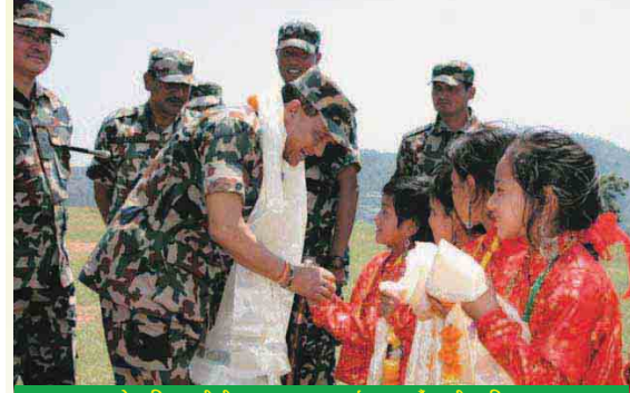
प्रधान सेनापति महारथी श्री रुक्मानुद कटवाललाई स्वागत गर्दै स्थानीय बालिकाहरु ।

यही वैशाख ५ गते प्रधान सेनापति महारथी श्री रुक्मानुद कटवालले ओखलढुङ्गा जिल्लाको वर्पालु र रुम्जाटार गा.वि.स.मा निर्माण सम्पन्न गरिएको करिब ६ की.मी. लामो मोटरवाटोको एक कार्यक्रमकावीच उद्घाटन गर्नुभयो ।