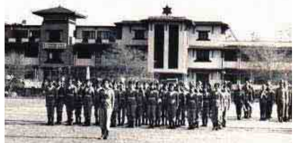
७ औं व्याचका छात्रछात्राहरु कवाज प्रदर्शनको लागि तयारी गर्दै (वि.सं. २०३७)।