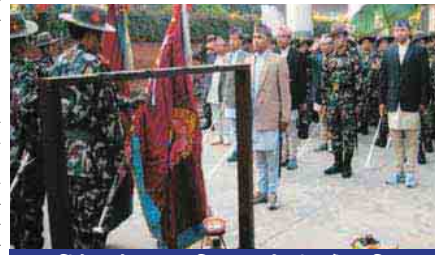
वार्षिकोत्सवको उपलक्ष्यमा निशान सलामी अर्पण गर्दै गणपति ।

सम्पन्न राहोस् उक्त गण स्व. राजा त्रिभुवन वीर विक्रम शाहको राज्यकालमा वि.सं. १९७२ साल चैत्र २९ गते खडा भएको थियो ।