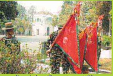
किराबलाई रामेछापबाट सिद्धदरबारमा स्थानान्तरण गरिँदै ।

जन्मभूमिको, रक्षा गर्ने बल, नारायण दल हामी सबैको, एउटै माझमा बल, नारायण दल । बुझ्ने गद्गदको बोली, विद्यालयलाई स्याम गछौं एउटै बोला सन्तु छुट्टैले, रक्षाभूमिमा लड्छौं । गर्नु रक्षा देवको मूडे, वीर पराक्रमी कर्मान्त बिडा बाग्छौं पुष्पको, बिरला र अमरकालीन । जन्मभूमिको, रक्षा गर्ने बल, नारायण दल