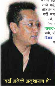
'बर्दी अनेकै अनुशासन हो'