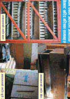
जवान रानीको अस्त्रको आन्तरिक शोधनाबाट खरिद गरिने गणका शान्तिहरू