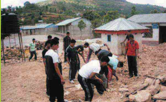
रामेछाप स्थित नं.१ श्री विद्यालय शापा गणका विभागाध्यक्ष सहयोगी सहयोगी नदी नारायण दलका सकल जवानहरू (वि.सं. २०६४) ।