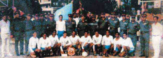
अन्तर मूल्य मलिनबल प्रतियोगिता २०६४ मा प्रथम नर पति सिद्ध सहित नारायण दल गणका खेलाडीहरू ।