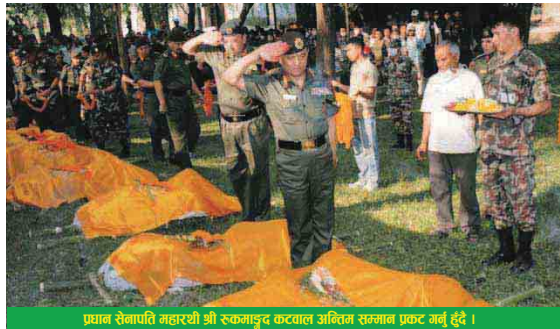
प्रधान सेनापति महारथी श्री रुक्मानुद कटवाल अतिथि सम्मान प्रकट गर्नु हुँदै ।