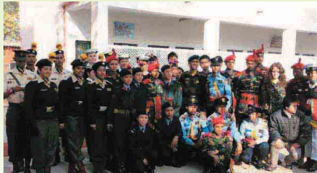
YEP अन्तर्गत भारत भ्रमण सिलसिलामा विभिन्न देशका NCC क्याम्पहरूको साथमा नेपाली क्याम्प छान्छात्रहरू ।

राष्ट्रिय सेवा दलको स्थापनाकालको पुर्वाह्वामा यसको सञ्चालन तत्कालीन श्री ५ को सरकार शिक्षा मन्त्रालय र रक्षा मन्त्रालयको संयुक्त तत्वाधानमा भएको थियो । वि.सं. २०२४ साल फाल्गुन १ गतेदेखि जङ्गी अड्डाको वलाधिकृत विभाग अन्तर्गत सै.वि.को नीति निर्देशन अनुसार सञ्चालन हुँदै आइरहेकोमा वि.सं. २०५१ सालदेखि वलाध्यक्ष विभाग अन्तर्गत रहि सञ्चालन