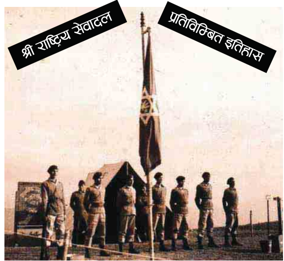
क्वार्टर गार्ड डिल अभ्यास गर्दै सिनियर डिभिजन चौथो व्याचका छात्रहरु (वि.सं. २०२६)।