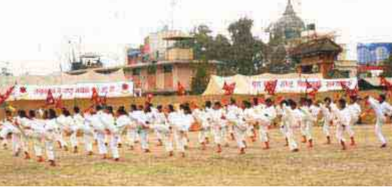
ते-क्वान्दो पी.टी. प्रदर्शन गर्दै क्याडेट छात्रछात्राहरू (वि.सं. २०६५)।

५०० जनालाई समावेश गरी तालिम सञ्चालन गर्ने गरेको छ। यसरी सञ्चालन गरीने तालिमको अवधि १०० दिनको हुने छ, जसमा ७९ दिन विद्यार्थीहरूलाई आ-आफ्नो शाखामा तालिम गराइन्छ भने बाँकी २१ दिन नवलपरासी जिल्लाको कोटडाँडीमा क्याम्प सञ्चालन गरी तालिम गराइन्छ।