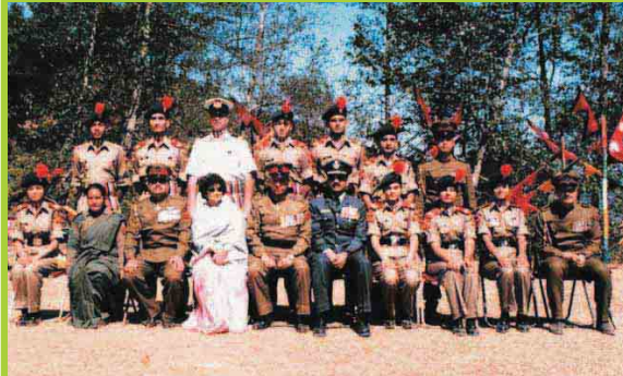
राष्ट्रिय सेवा दलको वार्षिक सैनिक शिबिरमा भारतीय NCC वयाडे ट टोलीका साथ रा.से.द.का अधिकृत तथा आमन्त्रित पाहुनाहरू ।