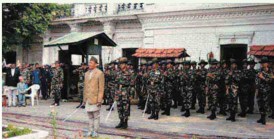
वार्डर जाईना विशाल सलानी अर्ण गर्दै गणका सफल दर्जा।

वि.सं. २०२५ साल फाल्गुन १७ गते यस पल्टनलाई नारायण दल गुल्म भनी पुनः नामाकरण गरियो। यसरी विभिन्न रूपमा विकसित हुने क्रमसँगै वि.सं. २०६२ साल श्रावण १९ गते मन्त्रिपरिषदको निर्णयबाट यो पल्टन नारायण दल गणमा परिणत गरियो। नारायण दल गणको नामबाट नामाकरण भएको यस गण विभिन्न आरोह-अवरोहको बावजुद समयका असंख्य बाधा र खुडकिला पार गर्दै नारायण दल पल्टन, हिमाली राईफल कम्पनी, नारायण दल गुल्म हुँदै आज नारायण दल गणको स्वरूपमा आइपुगेको छ। यस गणले नेपाल एकीकरण अभियानका साथै राष्ट्रको सार्वभौमसत्ता तथा अखण्डता जोगाउन इतिहासको कठिन अवस्थामा पनि सहभागी बन्दै राष्ट्र, राष्ट्रियता र नेपाली जनताप्रति समर्पित हुँदै आएको कुरा इतिहास साक्षी छ। "गर्न रक्षा देशको, भई वीर पराक्रमी सन्तति" आदर्श वाक्य रहेको यस गण, नेपाली सेनाको गौरवमय इतिहास बोकेका पल्टनहरूमध्ये एक हो।