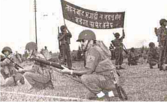
राष्ट्रिय सेवा दलद्वारा सञ्चालन गरिएको प्रमुख जिल्ला अधिकारी तालिम अन्तर्गत एड टु सिभिल पावरको अभ्यास गर्दै प्रमुख जिल्ला अधिकारीहरू (वि.सं. २०३१)

राष्ट्रिय सेवा दलले आफ्नो उद्देश्य परिपूर्तिको लागि स्थापनाकालदेखि वि. सं. २०३० सालसम्म सिनियर डिभिजन (महाविद्यालय स्तर) अन्तर्गत ९ व्याच, प्र.जि.अ. तालिम ६ व्याच, स्थानीय विकास अधिकारी तालिम ३ व्याच, प्राध्यापक अधिकृत तालिम २ व्याच गरी जम्मा २० व्याच