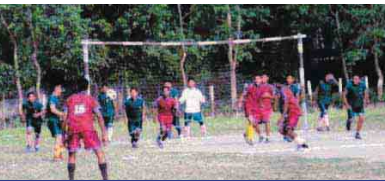
जबरजंग गणको वार्षिकोत्सवको उपलक्ष्यमा आयोजित खेलकुद ।