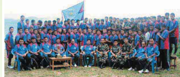
गणको १७३ औं वार्षिक उत्सवको अवसरमा सञ्चालित अन्तरगुल्म खेलकुद प्रतियोगितामा च्याम्पियनशिप गोष्पित महुँत गुल्म तथा टुफिस्तहित गण परिवार (वि.सं. २०६५)।