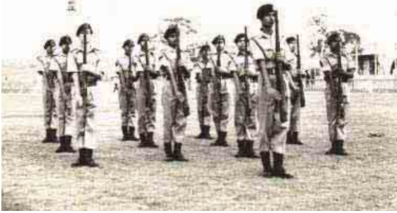
सिनियर डिभिजनका क्याडेटहरू हतियार तालिम गर्दै।

हाल यस सेवा दलले हरेक वर्ष पूर्वाञ्चलमा ७५, मध्यमाञ्चलमा २५०, पश्चिमाञ्चलमा ७५, मध्य पश्चिमाञ्चलमा ५० र सुदूर पश्चिमाञ्चलमा ५० जना छात्र/छात्राहरू बराबरी गरी जम्मा